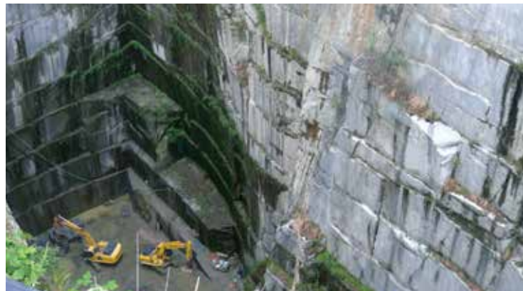
大島和の丁場（採石場）

丁場が大きく、安定した採掘が行われています。色目がやや薄く、墓石の色合わせがしやすい特長があります。