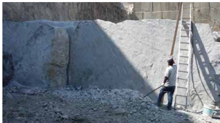
大島煌の丁場（採石場）

職人により選び抜かれたプレミアムランクの大島石。歳月を重ねるほどに青磁のような美しさを増していきます。