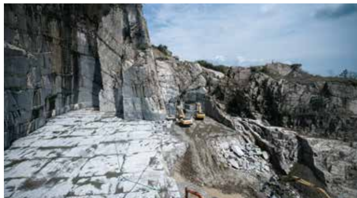
大島闌の丁場（採石場）

採石量が少なく厳選された最高峰の大島石。 最も色目が濃く、石目が細かい石であり、 その存在感は他を圧倒します。