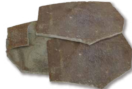
鉄平石(インドネシア) 大乱形 R1-11WR02

パレット入数 約18m 2 / パレット サイズ(mm) Φ600~800 t=20~40 仕上げ 乱形 自然肌