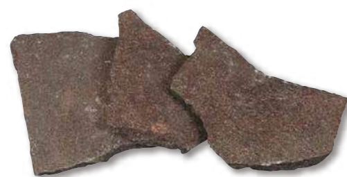
ポリフィードミックス 乱形 R1-09WR01

パレット入数 約10m 2 / パレット サイズ(mm) t=20~40 仕上げ 乱形 自然肌