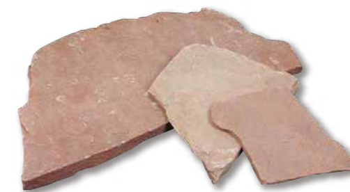
サンドピンク 乱形 R1-08WR01

箱入数 0.5m 2 パレット入数 15m 2 サイズ(mm) 乱形(10~30厚) 仕上げ 割肌