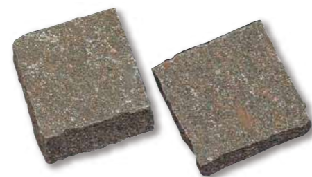
ポリフィードミックス ピンコロ R1-09W102

パレット入数 830個 サイズ(mm) 100×100×20~40 仕上げ キューブ 自然肌