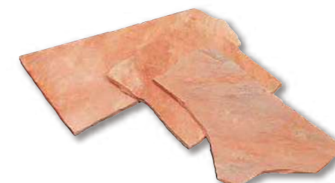
アルビノピンク 乱形 R1-02WR01