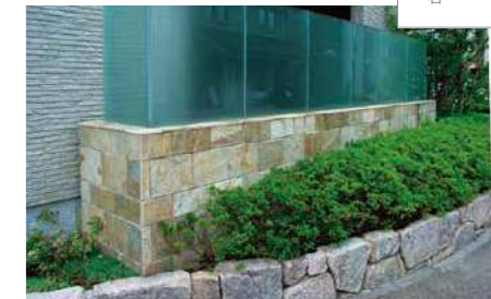
品番: R1-06W36 サンドゴールド 方形