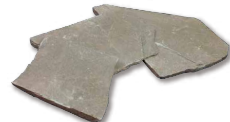
フラットグリーン 乱形 R1-07WR01

箱入数 0.5m 2 パレット入数 15m 2 サイズ(mm) 乱形(10~35厚) 仕上げ 割肌