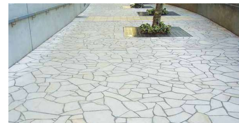
品番: R1-01WR01 アルビノミックス