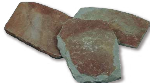
鉄平石(インドネシア) 乱形 R1-11WR01

使用数量 3.5束 / m 2 パレット入数 約15m 2 / パレット サイズ(mm) Φ400~500 t=10~30 仕上げ 乱形 自然肌