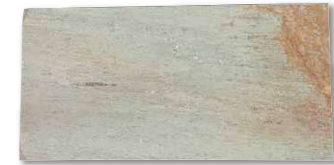
サンドゴールド 方形 R1-06W36