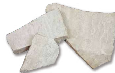
アルビノホワイト 乱形 R1-03WR01