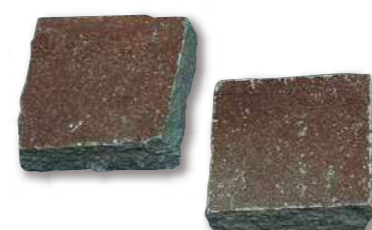
鉄平石(インドネシア) ピンコロ石 R1-11W90

パレット入数 1000枚 / パレット サイズ(mm) 90×90 t=20~30 仕上げ 方形 自然肌