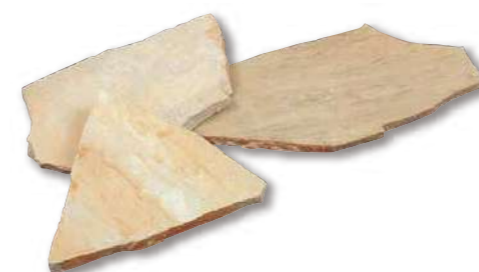
アルビノミックス 乱形 R1-01WR01