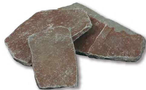
鉄平石(インドネシア) スリ乱形 R1-11SR01

使用数量 4束 / m 2 パレット入数 約15m 2 / パレット サイズ(mm) Φ400~500 t=10~30 仕上げ 乱形 自然肌(スリ)