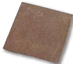
鉄平石(インドネシア) 方形 R1-11W30

パレット入数 200枚 / パレット サイズ(mm) 300×300 t=10~30 仕上げ 方形 自然肌