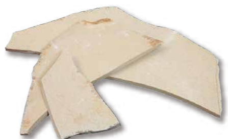
ソルンフォーヘン 乱形