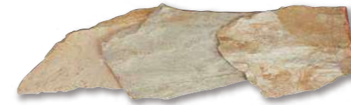
サンドゴールド 乱形 R1-06WR01

箱入数 0.5m 2 パレット入数 15m 2 サイズ(mm) 乱形(10~35厚) 仕上げ 割肌