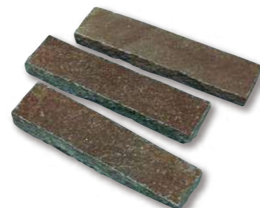
鉄平石(インドネシア) 小端石 R1-11W37

使用数量 80本 / m 2 パレット入数 550枚 / パレット サイズ(mm) 300×70 t=25~35 仕上げ 方形 自然肌