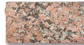
シュタインフィックス 赤 SF-KB1 T=60 T=80