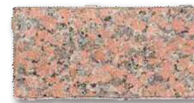
シュタインフィックス 赤 SF-WB1 T=60 T=80