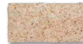
シュタインフィックス 錆 SF-WB5 T=60 T=80