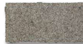
シュタインフィックス 灰 SF-WB4 T=60 T=80