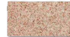
シュタインフィックス 錆 SF-KB5 T=60 T=80