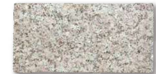
シュタインフィックス 桜 SF-KB3 T=60 T=80