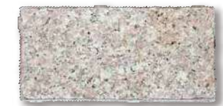
シュタインフィックス 桜 SF-WB3 T=60 T=80