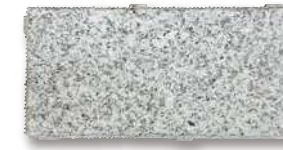
シュタインフィックス 白 SF-WB2 T=60 T=80