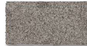
シュタインフィックス 灰 SF-KB4 T=60 T=80