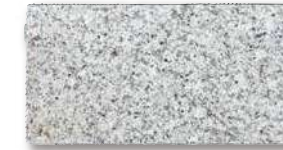
シュタインフィックス 白 SF-KB2 T=60 T=80