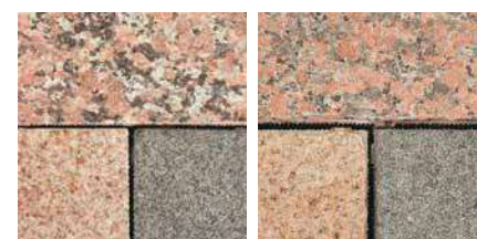
KBシリーズ WBシリーズ